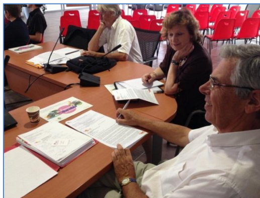
Groupe de travail du Conseil de développement du Sicoval

L'UNADEL réalise depuis plusieurs années un accompagnement des dynamiques de développement des acteurs locaux, à leur demande, en particulier pour les membres de conseils de développement. Ce type d'appui s'organise le plus souvent sous la forme de formation-actions réalisées dans la durée, de 6 mois à 2 ans, et peut permettre de redynamiser ou même de créer un conseil de développement dans un territoire urbain ou rural. En 2014, l'UNADEL a ainsi accompagné les dynamiques de 4 territoires : la création du conseil de développement de la Communauté d'agglomération du Sicoval (31), et la redynamisation des conseils de développement du Pays de Thiérache (02), du Pays du Trégor Goëlo (22) et du Pays de Yon et Vie (85).