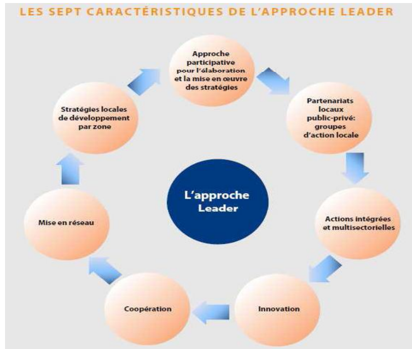
Schéma extrait du Rapport de la Cour des Comptes Européenne, 2010, Mise en œuvre de l'approche LEADER pour le développement rural