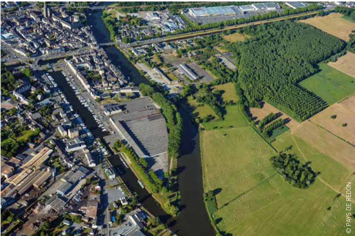
VUES D'ENSEMBLE DU PAYS DE REDON-BRETAGNE SUD