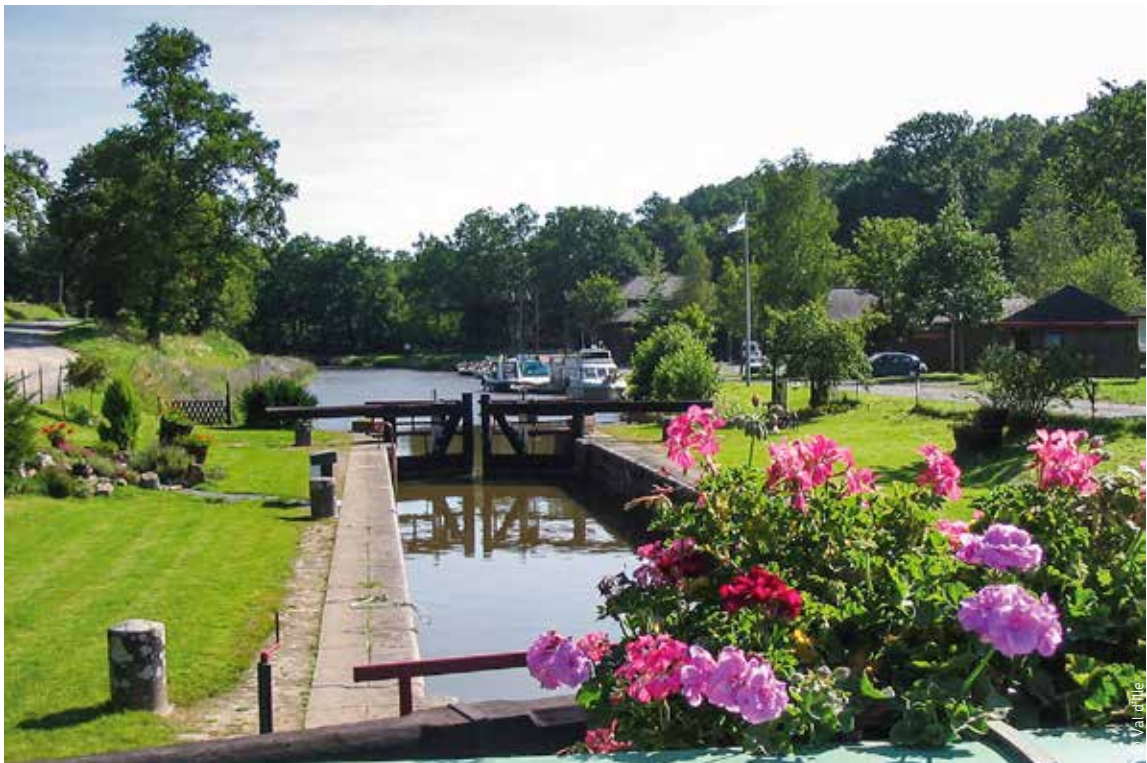
VUES D'ENSEMBLE DU VAL D'ILLE